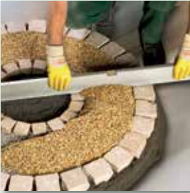
über Lehren abziehen