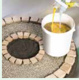
Splittbinder dem Mineralstoff zugeben