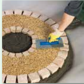
verdichten und glätten