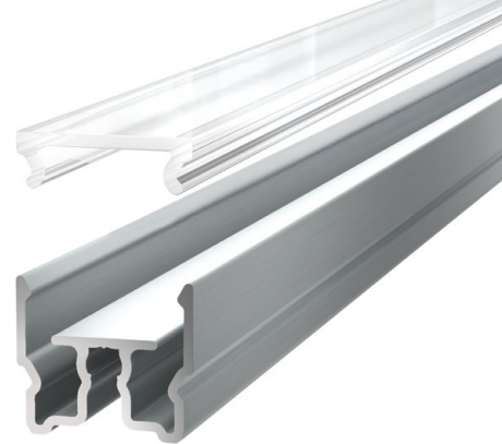
LED-Profil und Abdeckung