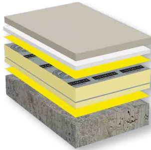
Wärmedämmung unter Estrich oder Fußbodenheizung