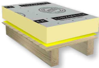
Dämmung der obersten Geschossdecke