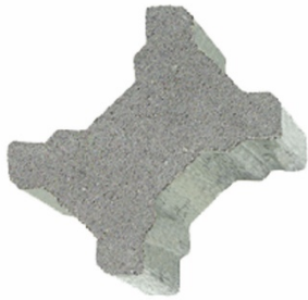
18 x 13,3 x 8 cm (Normalstein)