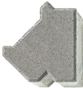
22 x 19,5 x 8 cm (Randstein)