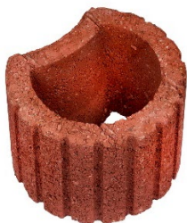
Ø 30 x 20 cm