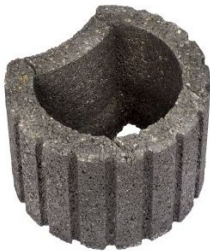
Ø 30 x 20 cm