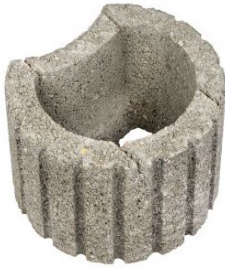
Ø 30 x 20 cm