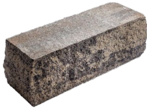
37 x 12,5 x 12,5 cm