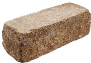
37 x 12,5 x 12,5 cm