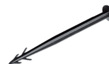
Kunststoffnagel Länge 150 bis 275 mm