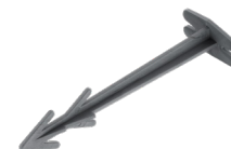
Kunststoffnagel Länge 75 bis 125 mm