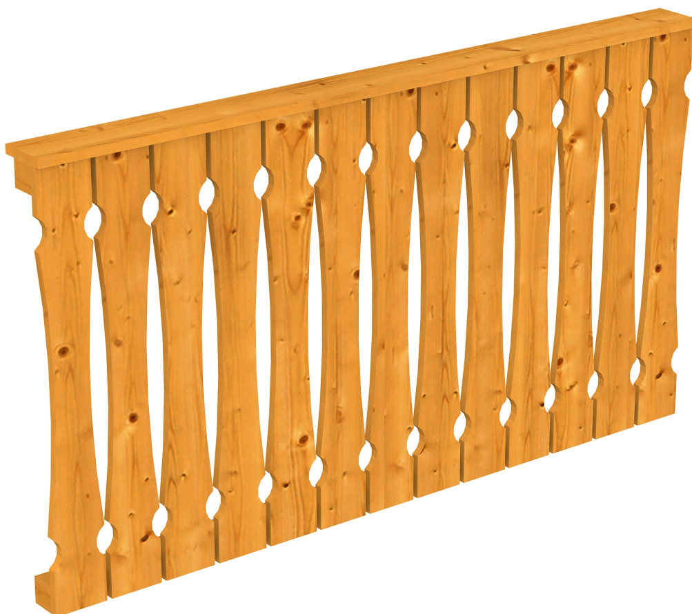
Produktbild AK-Brüstung 170cm