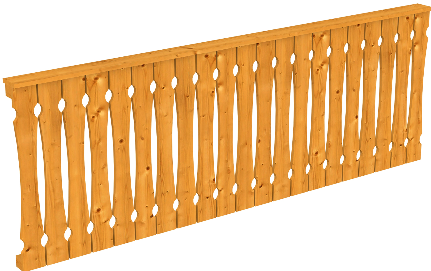
Produktbild AK-Brüstung 270cm