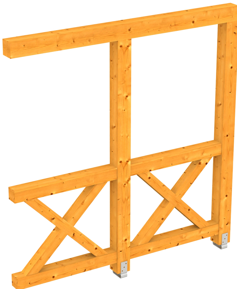
Produktbild AK-Seitenwand 205cm