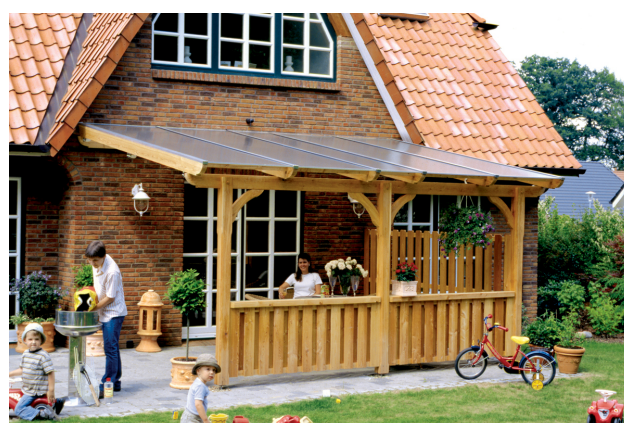
Kundenfoto: Terrassenüberdachung mit Brüstungen und Seitenwand