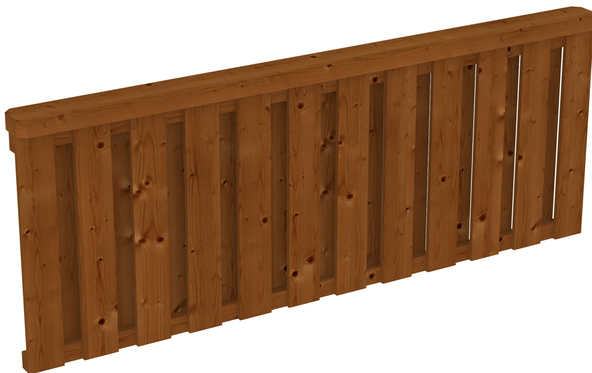
Produktbild Brüstung Deckelschlung 220cm