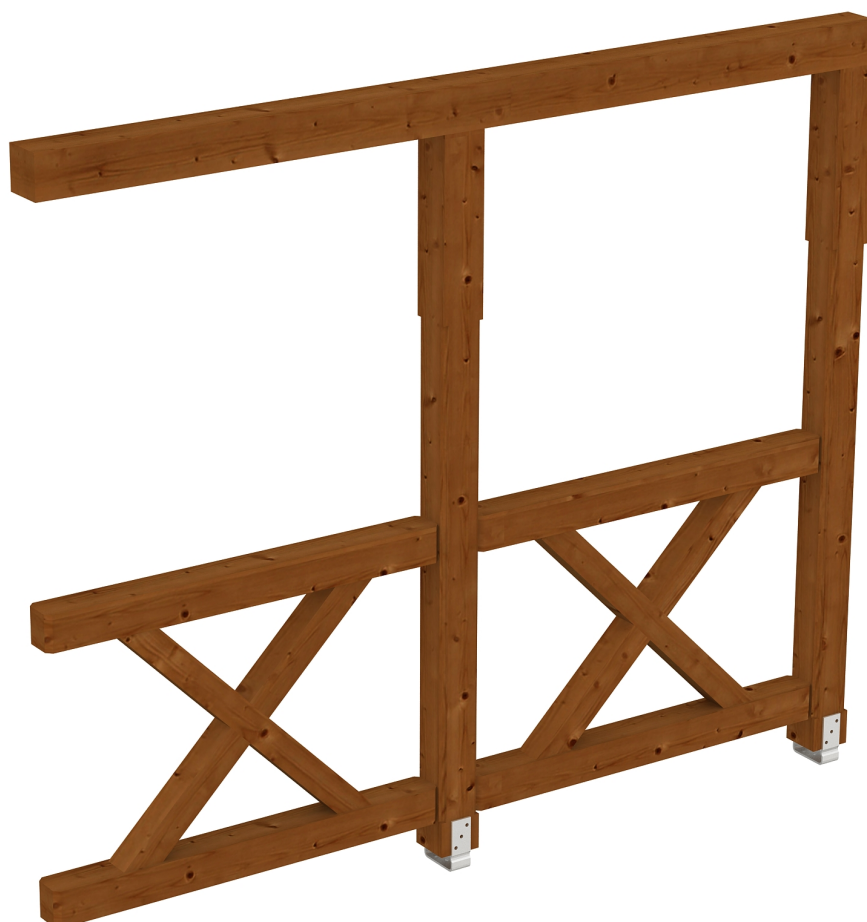
Produktbild AK-Seitenwand 255cm