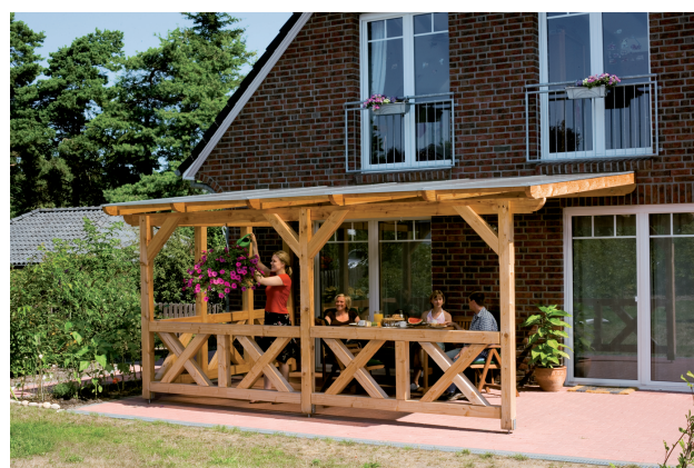
Terrassenüberdachung mit Brüstungen und Seitenwand