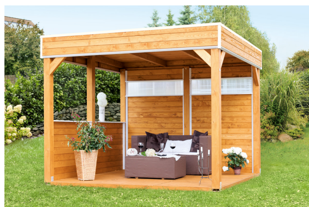
Kundenfoto: Pavillon mit Zubehör