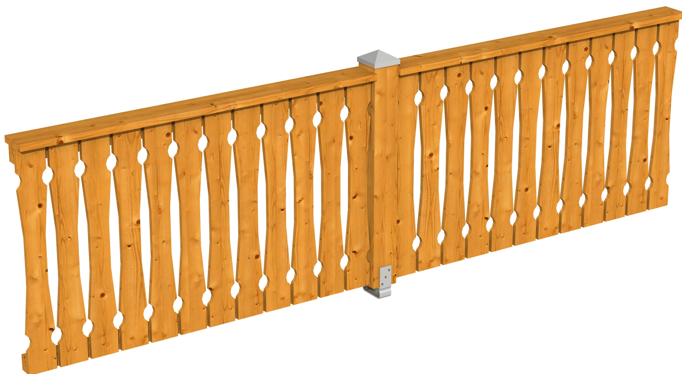
Produktbild Brüstung 335 cm