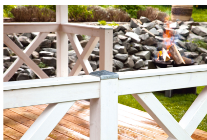
Kundenfoto: Andreaskreuz in weiss