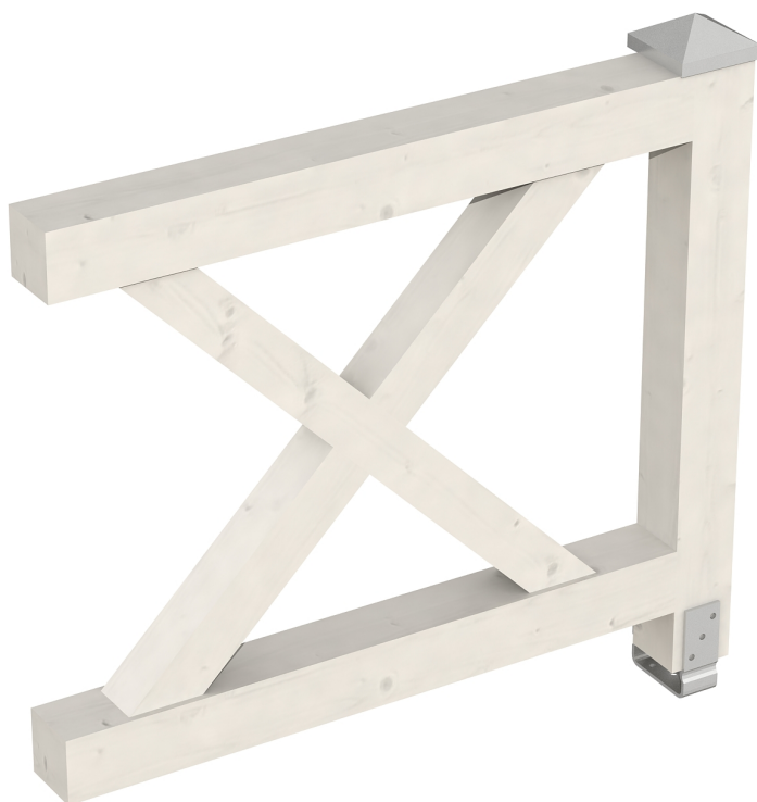
Produktbild AK-Brüstung 108cm