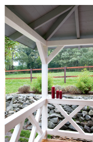
Kundenfoto: Andreaskreuz in weiss