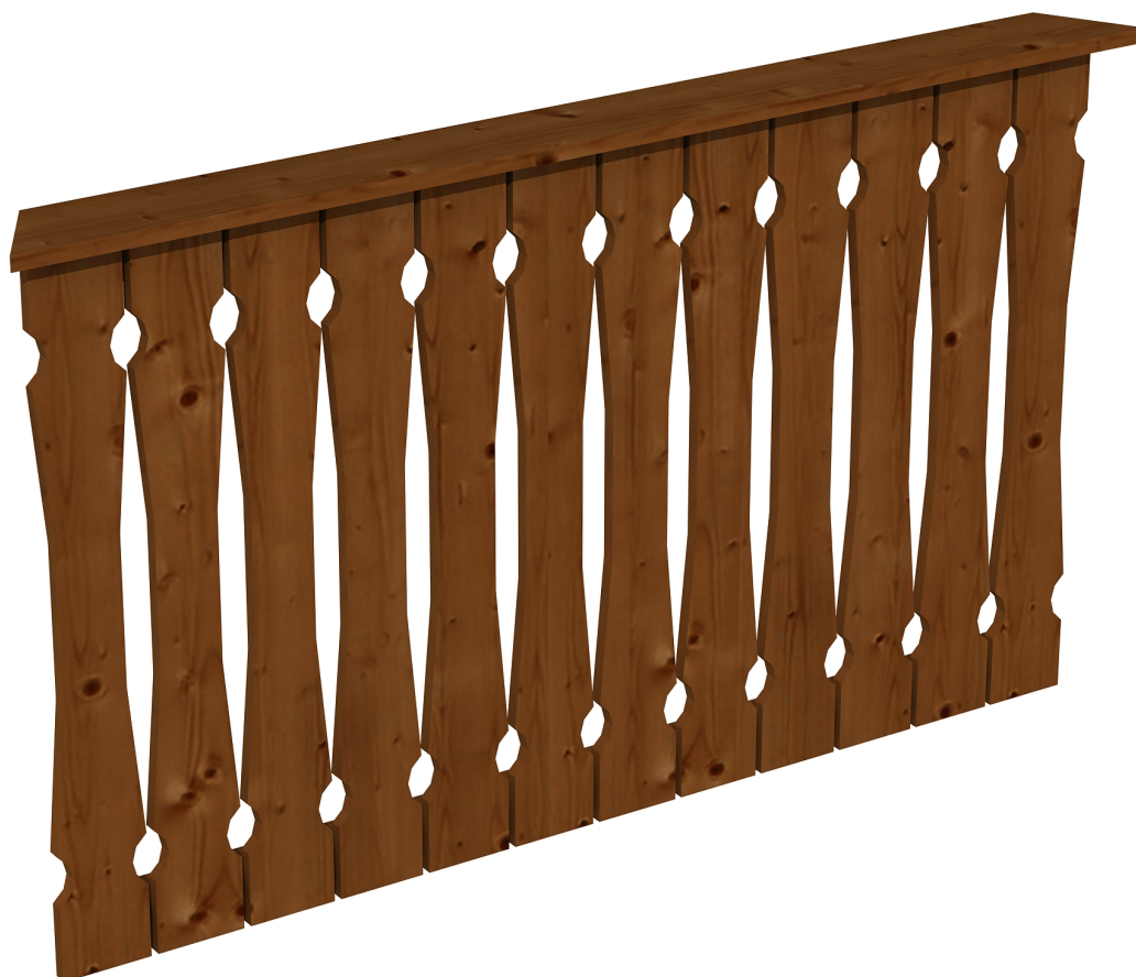
Produktbild Brüstung 150 cm