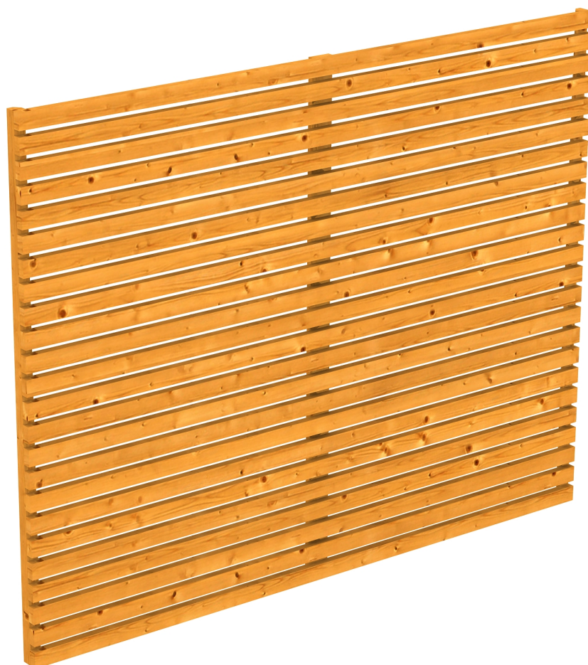
Produktbild Seitenwand Rhombus