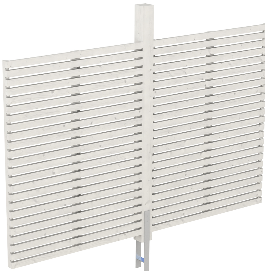
Produktbild Rückwand Rhombus