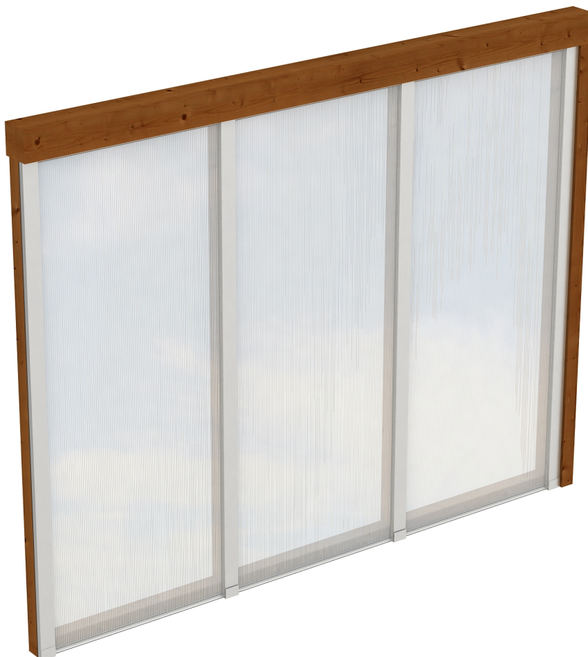
Produktbild Polycarbonat-Seitenwand 305cm