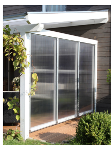
Kundenfoto: Terrassenüberdachung weiss mit Seitenwand Polycarbonat