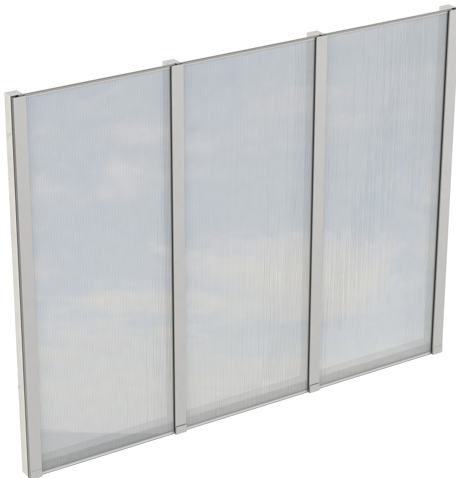
Produktbild Polycarbonat-Seitenwand 255cm