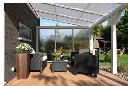
Kundenfoto: Terrassenüberdachung weiss mit Seitenwand Polycarbonat