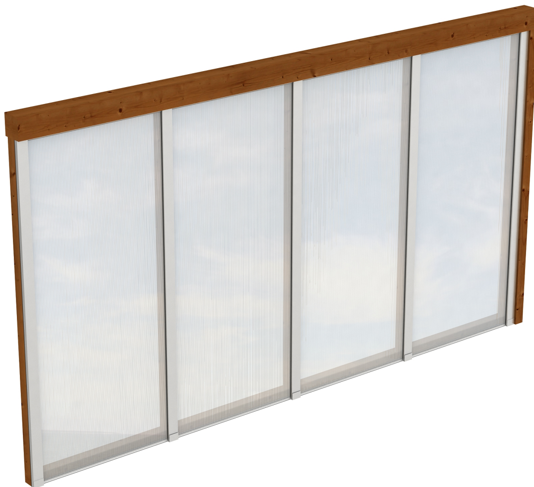
Produktbild Polycarbonat-Seitenwand 355cm