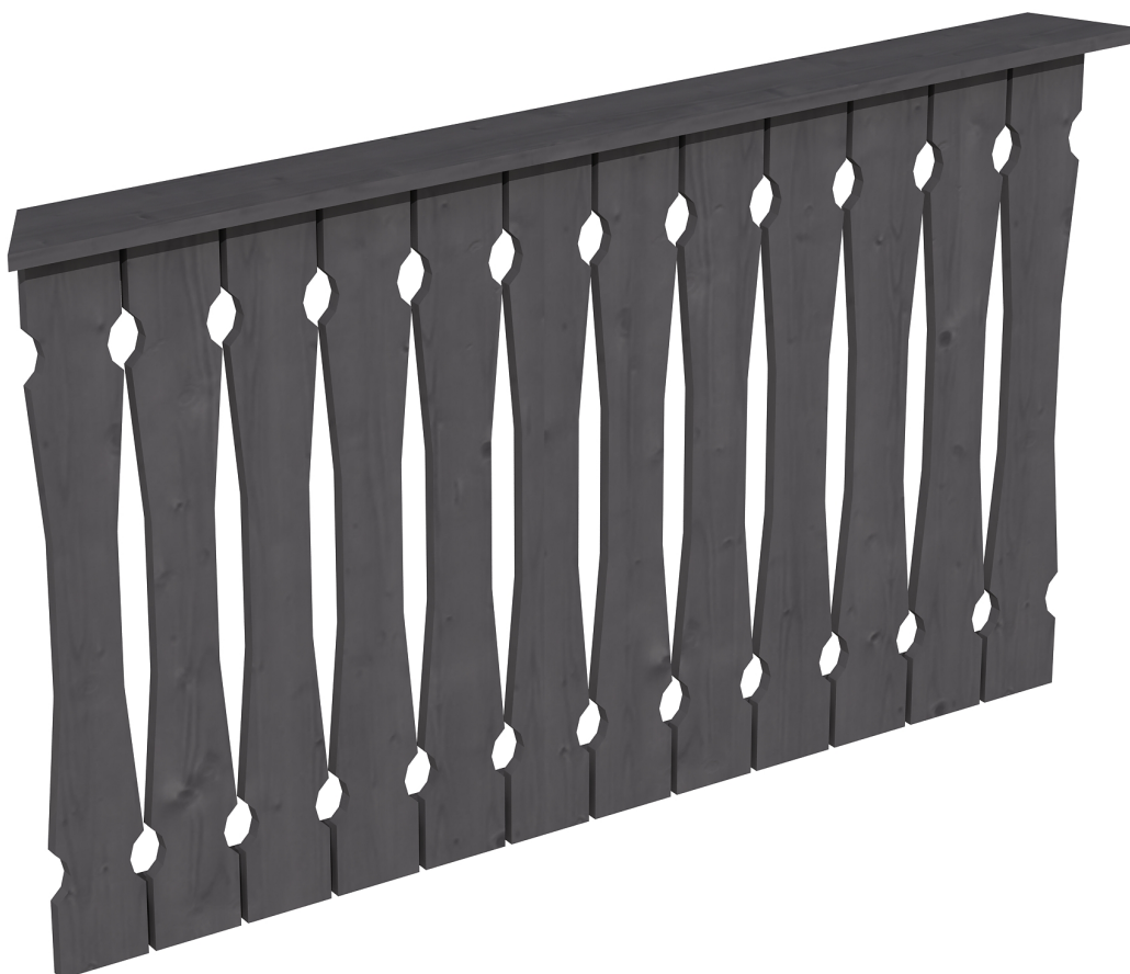
Produktbild Brüstung 150 cm