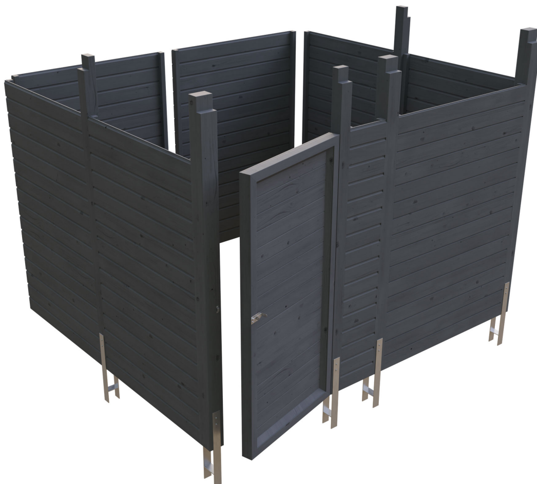
Produktbild Abstellraum C8