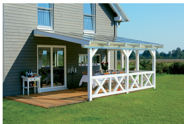
Kundenfoto: Terrassenüberdachung weiss mit 2 Brüstungen und Seitenwand