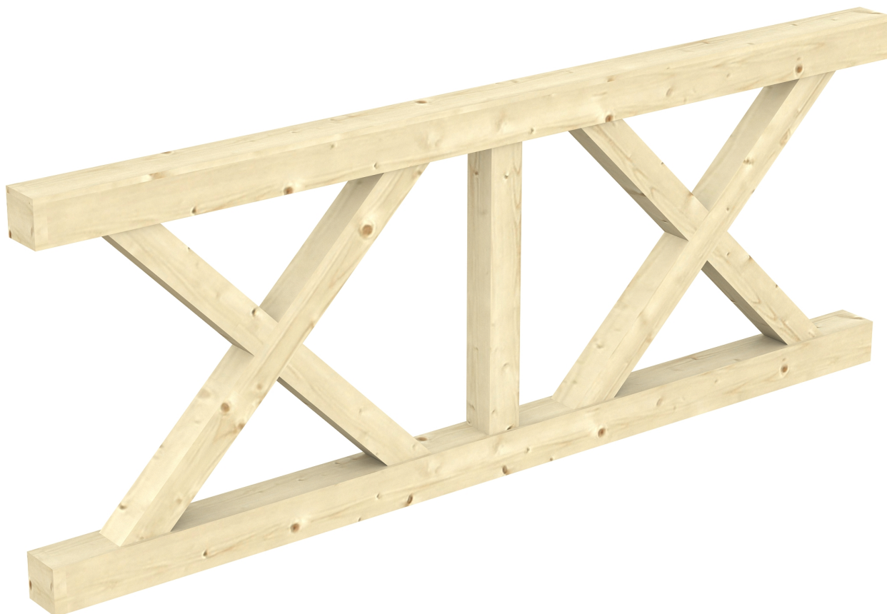
Produktbild AK-Brüstung 220cm