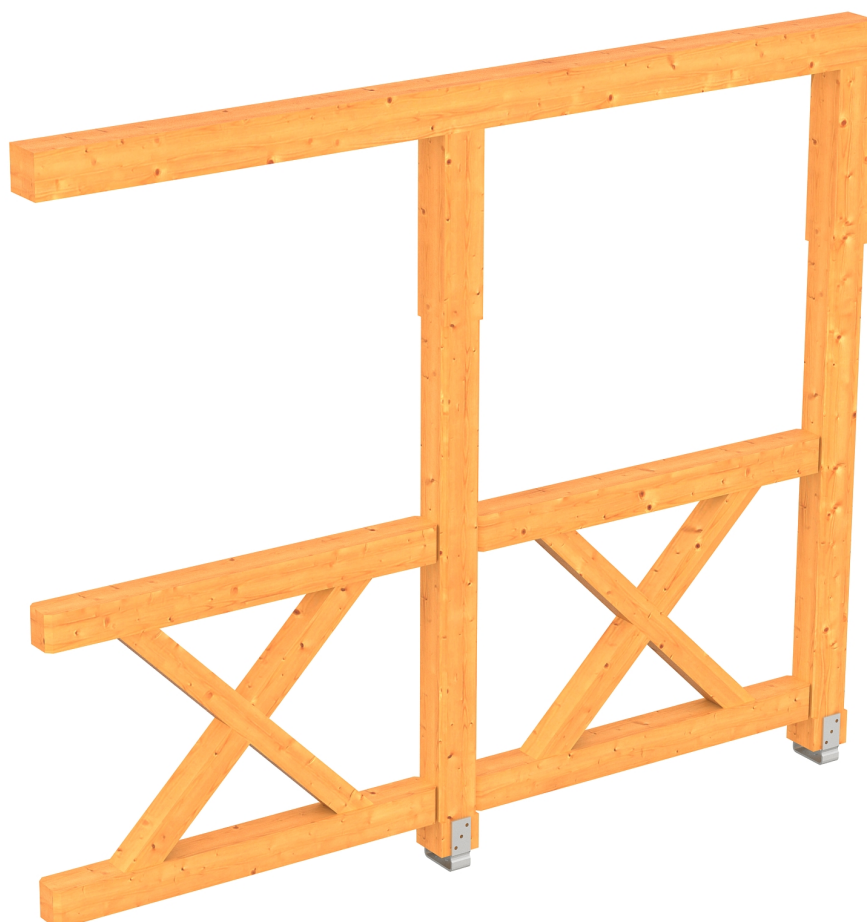
Produktbild AK-Seitenwand 255cm