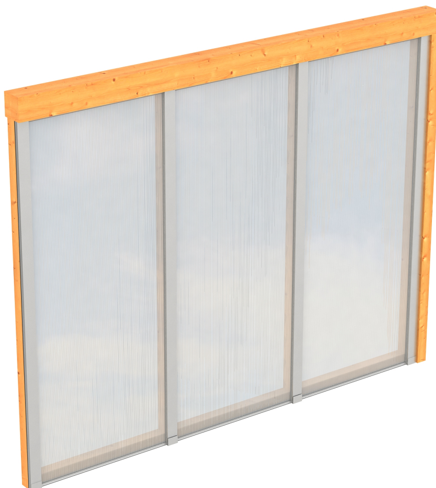
Produktbild Polycarbonat-Seitenwand 255cm