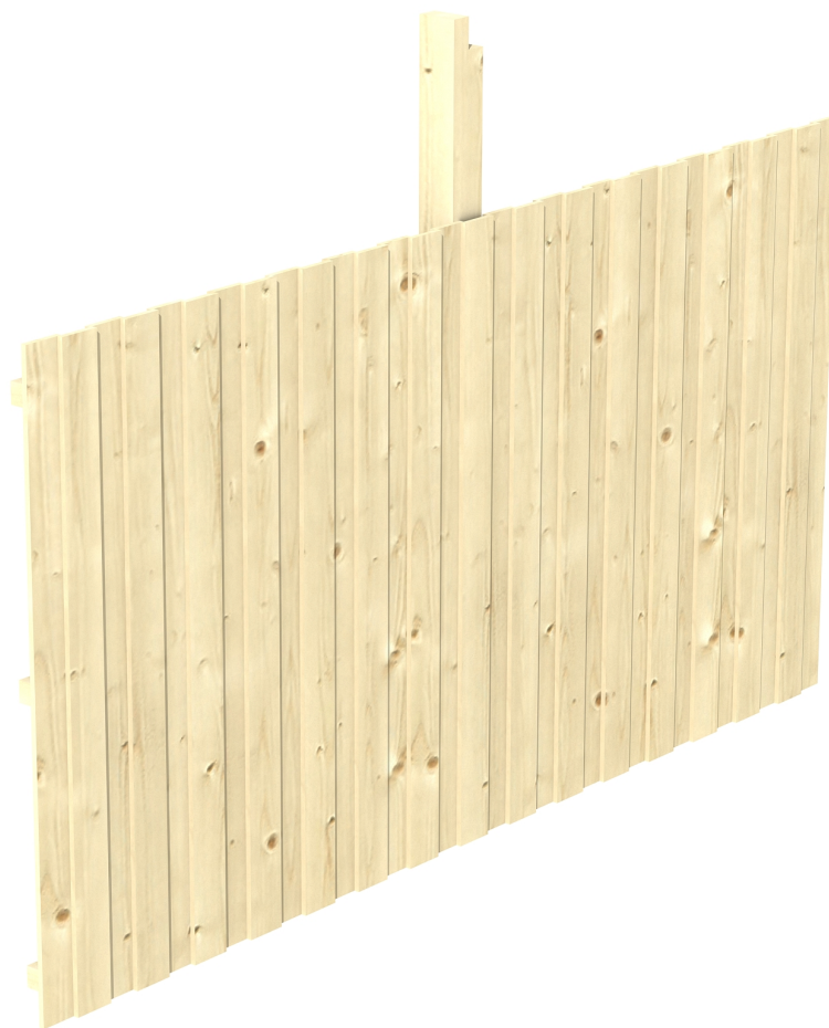
Produktbild Rückwand Deckelschalung