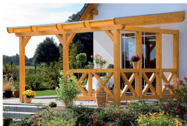
Kundenfoto: Terrassenüberdachung mit einer Brüstung und Seitenwand