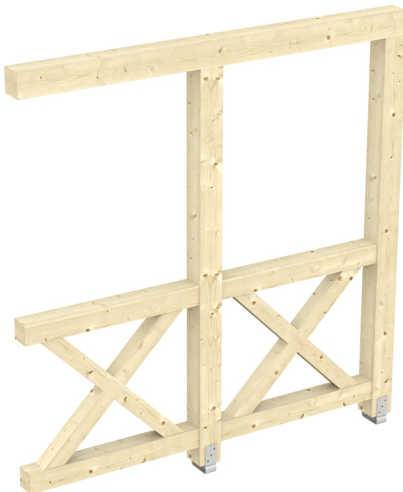
Produktbild AK-Seitenwand 205cm