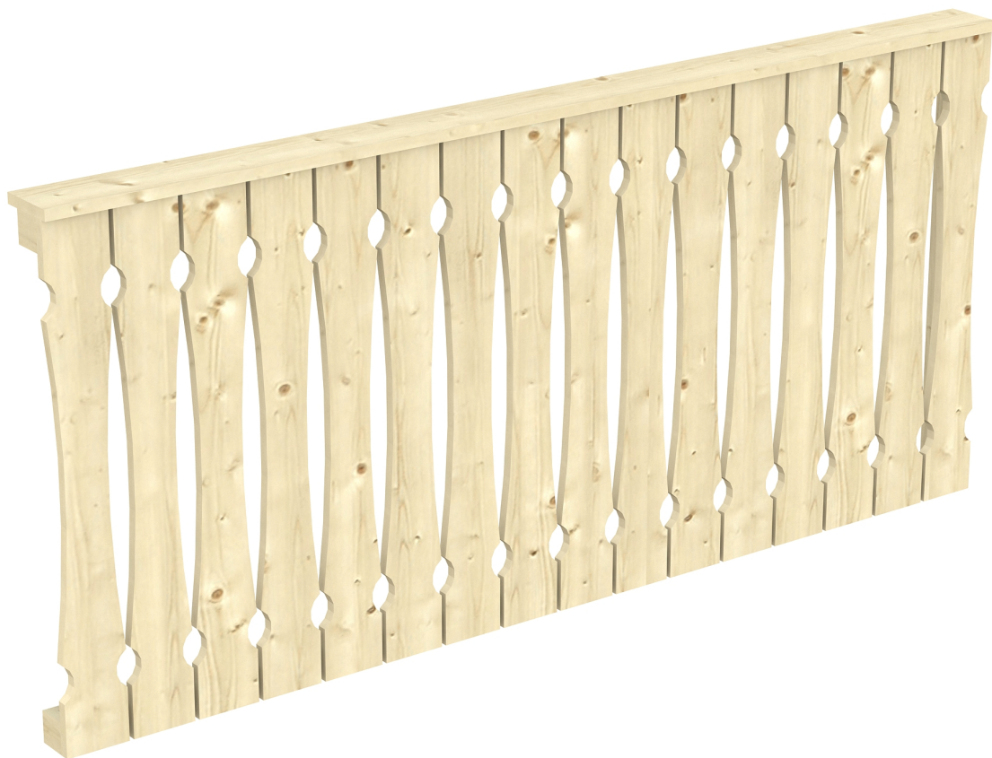
Produktbild AK-Seitenwand 205cm