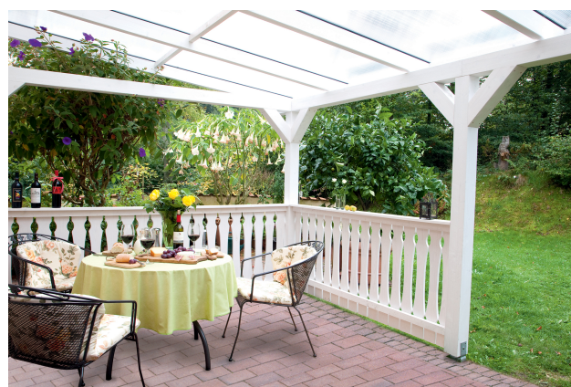
Kundenfoto: Terrassenüberdachung in weiss mit Brüstungen