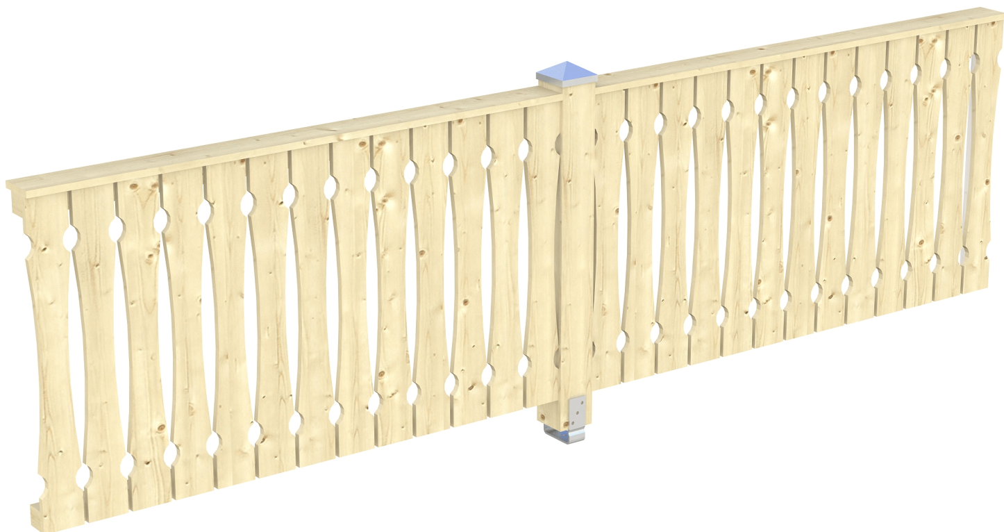
Produktbild AK-Seitenwand 355cm