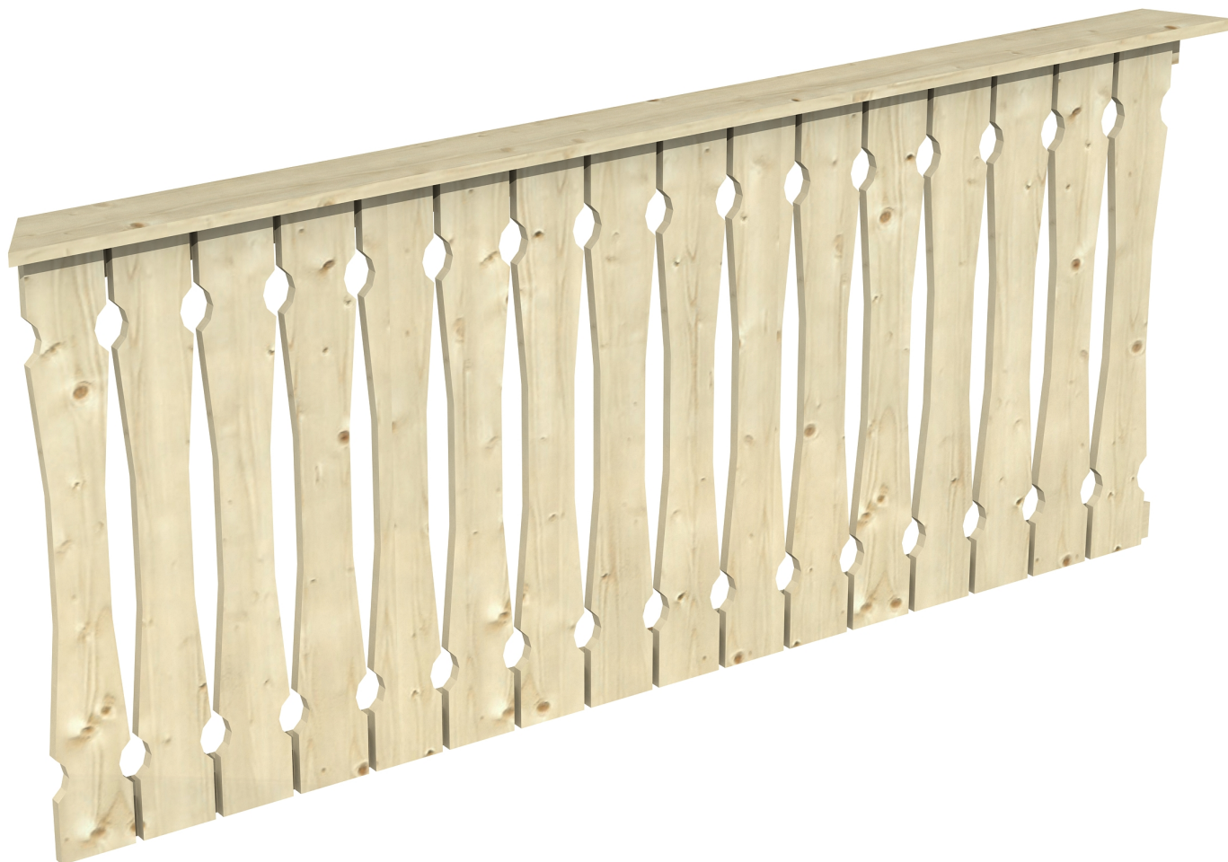
Produktbild Brüstung 210 cm