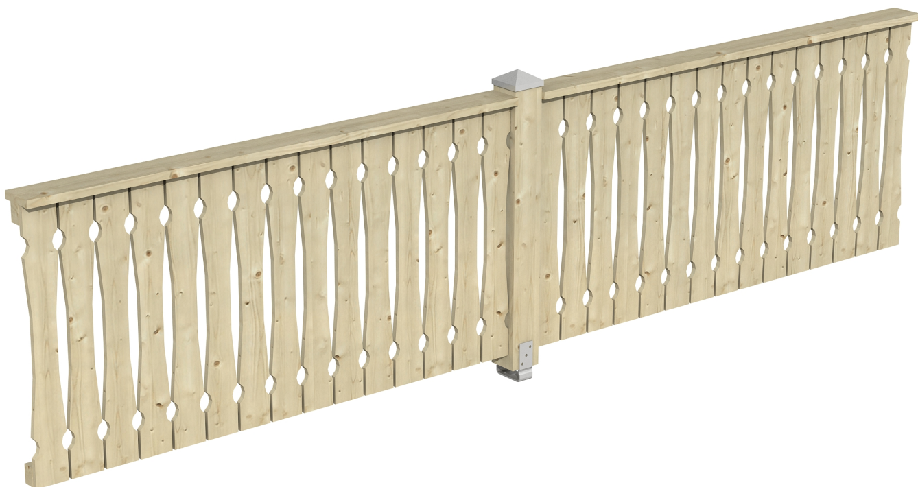
Produktbild Brüstung 400 cm