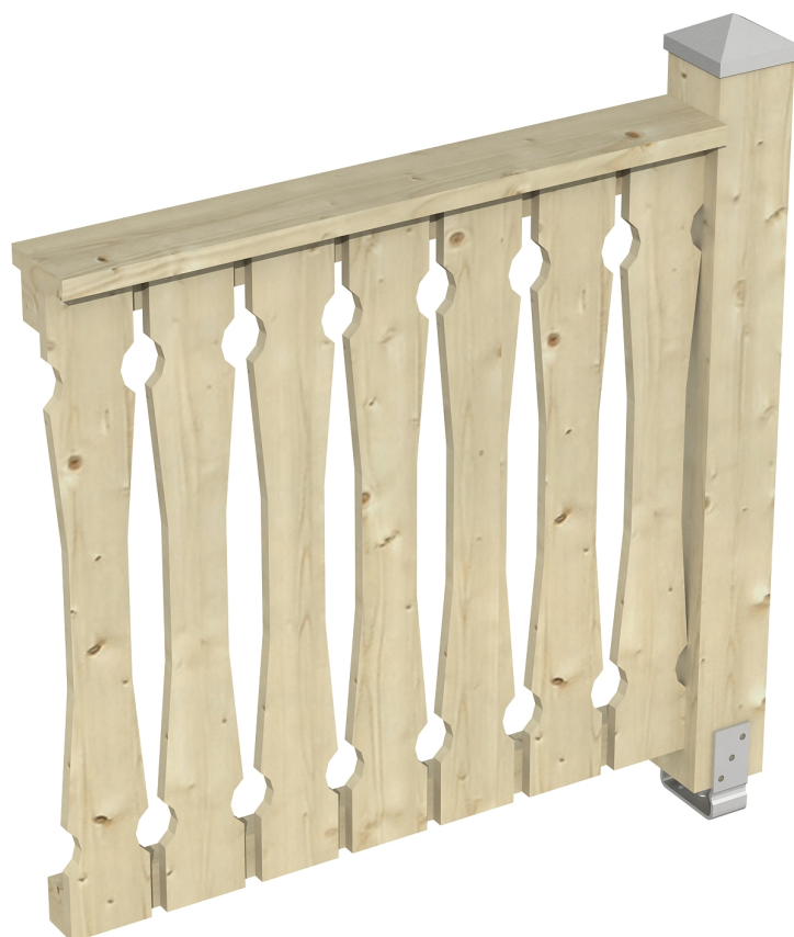
Produktbild Brüstung 108 cm