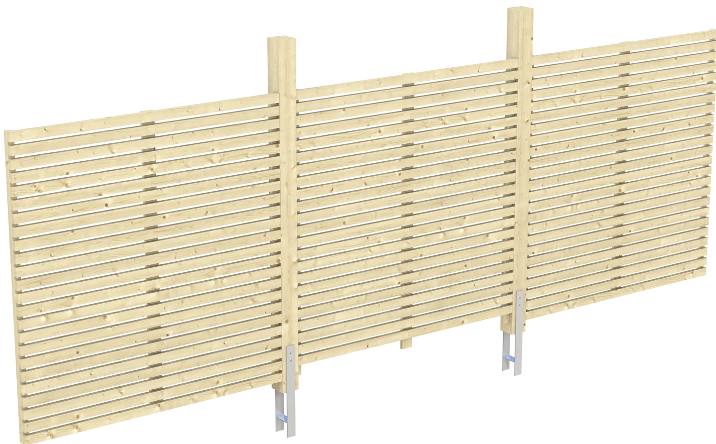
Produktbild Rückwand Rhombus