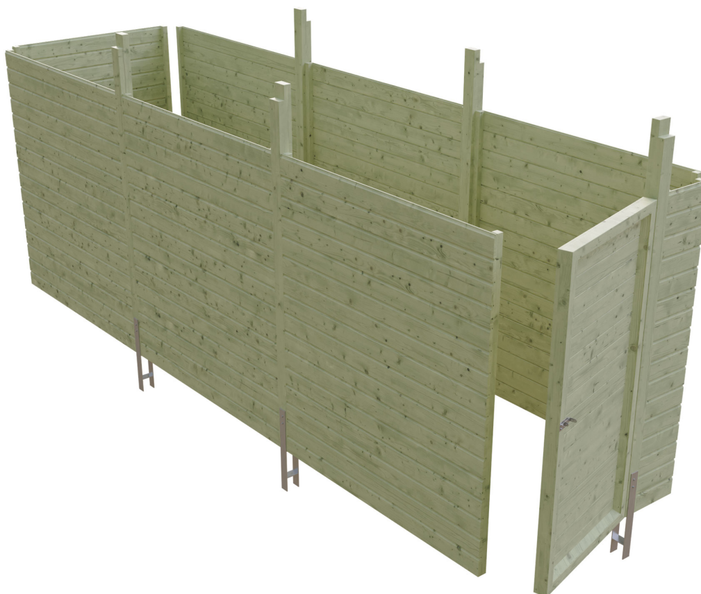
Produktbild Abstellraum C5