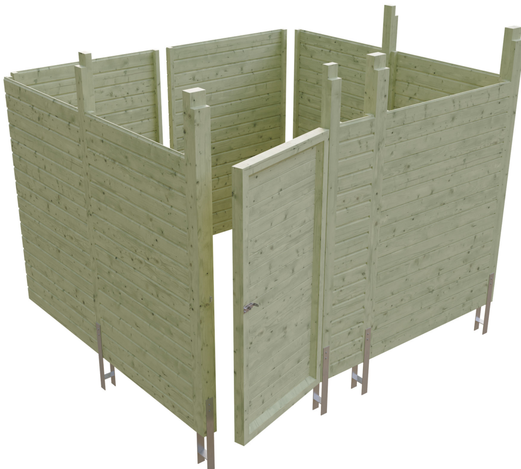
Produktbild Abstellraum C8