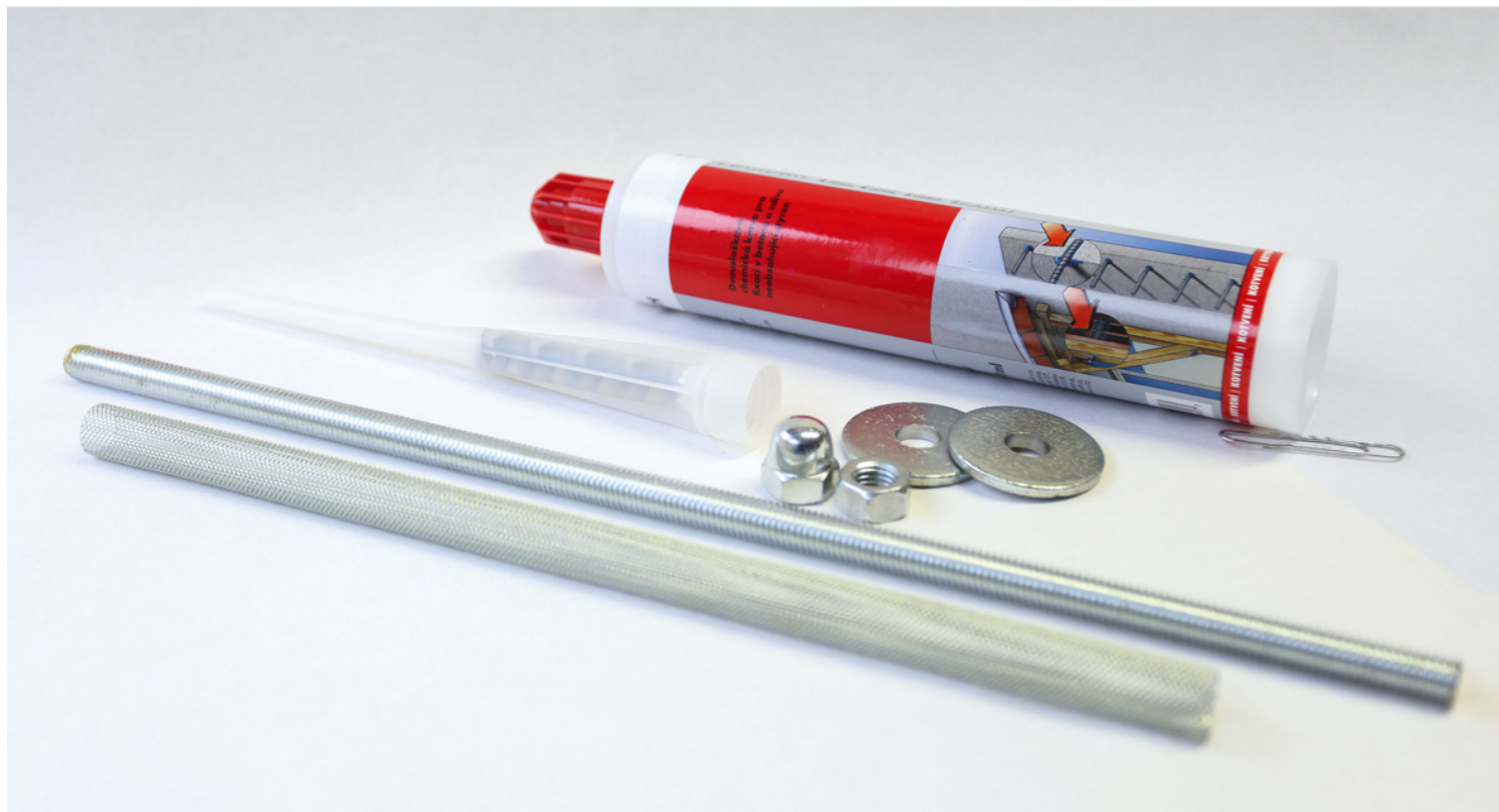
Materialien vom Wandbefestigungsset