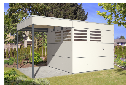
Seitliche Überdachung mit Haus