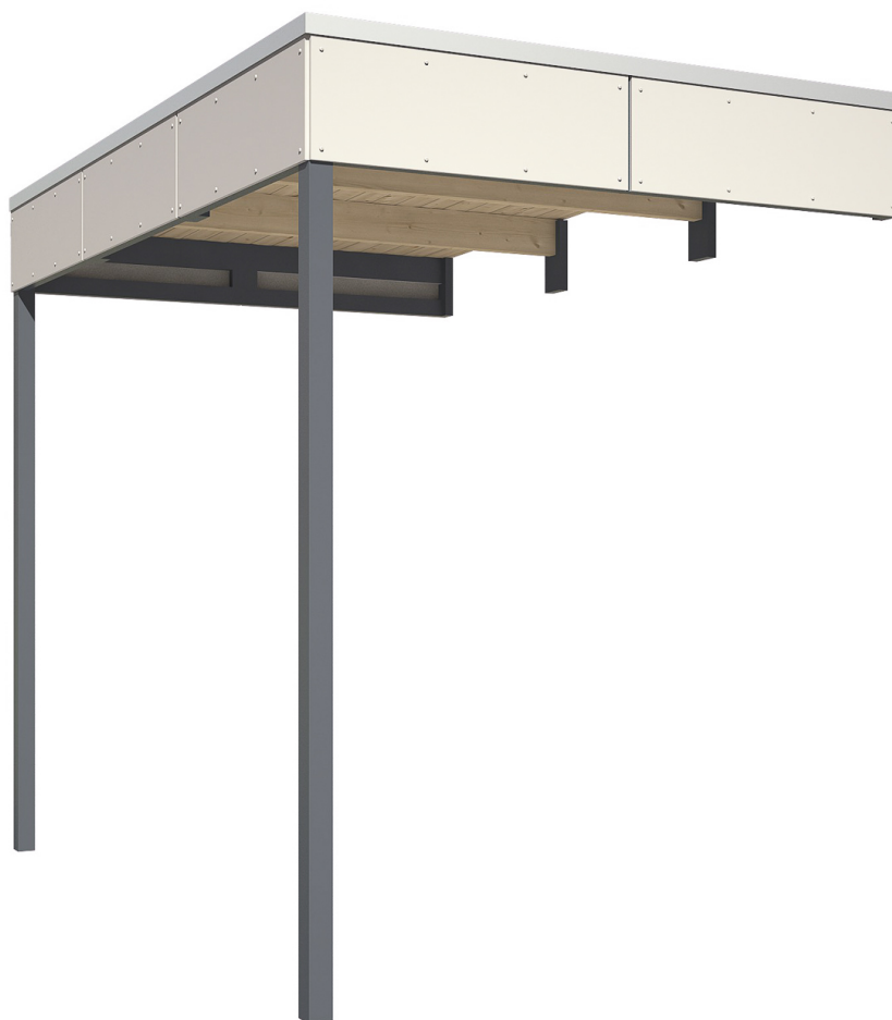
Produktbild Seitliche Überdachung