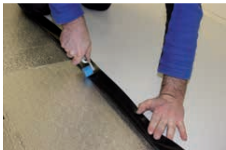
1. Aufkanten des vliesfreien Schweißbands der ersten Dachbahn, 6 cm.