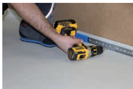
5. Die Nahtüberlappungen sind konventionell gemäß Vorgaben der FLAGON FPO Verlegeanleitung zu verschweißen. Kopfstöße müssen mit einem FLAGON FPO Abdeckstreifen überschweißt werden. Eine lineare Randfixierung mit Befestigungsschiene ist obligatorisch.