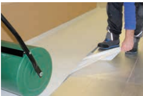
2. Erste Dachbahn am aufgehenden Bauteil ausrichten und PE-Folie unterseitig herausziehen. Bitte beachten: Faltenbildung bei Verschiebung der Bahn möglich.