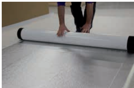
3. Die Folgebahn ausrollen, ausrichten, bis zur Mitte zurückrollen und die unterseitige PE-Folie vorsichtig, ohne Beschädigung der Dachbahn einschneiden.

Tipp: Für eine optimale Verarbeitung ausgerollte Bahnen vor dem Ausrichten im Idealfall ca. 10–15 min ruhen lassen.