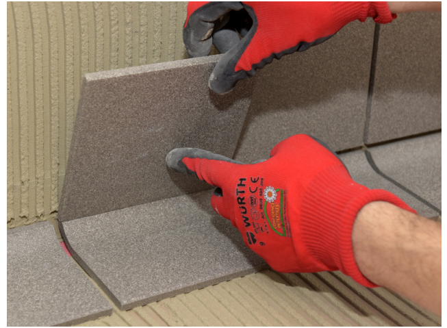
... und Wand verlegt.