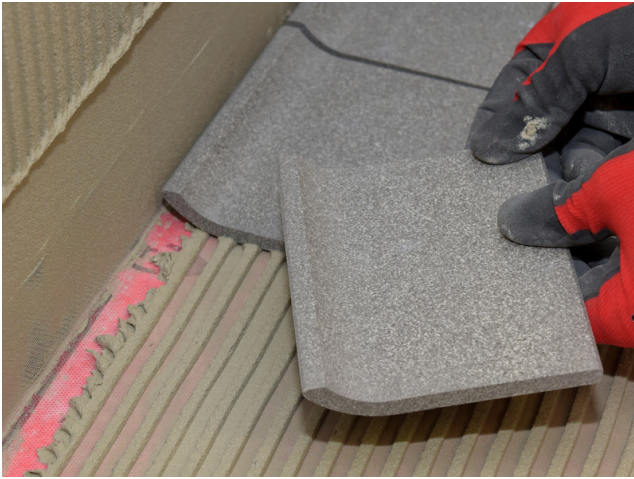
Anschließend werden wie gewohnt die Fliesen – hier Hohlkehlenfliesen – an Boden ...