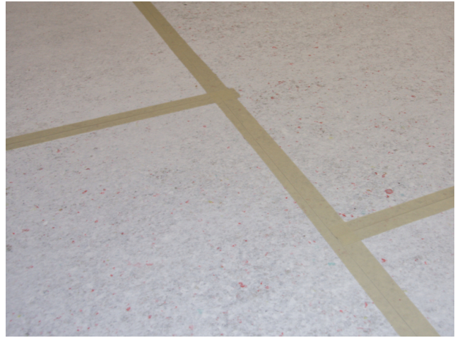
Zur Vermeidung von Mörtelbrücken (Körperschallbrücken) werden die Stöße der Platten mit Klebeband überklebt.