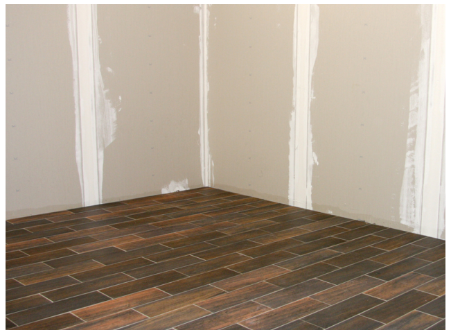
Entkoppelter, frisch verlegter und verfugter keramischer Belag auf einem Holzuntergrund.