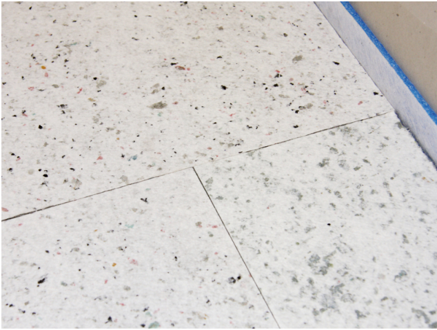
Plattenstöße nebeneinanderliegender Reihen werden versetzt verlegt.