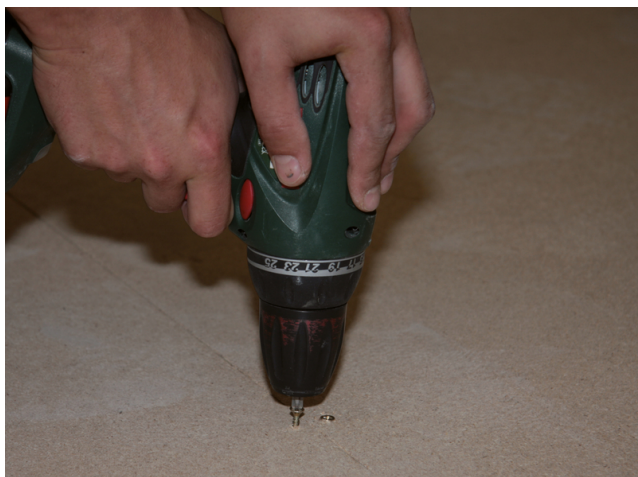
Vor der Verlegung der Sopro FliesenDämmPlatte auf z. B. Spanplatten, sind die Spanplatten fest anzuschrauben.