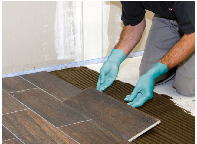
Verlegen der keramischen Fliesen in das vorbereitete frische Mörtelbett.