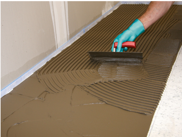
Auftrag von z. B. Sopro's No. 1 Flexkleber mit einer Zahnkelle auf die Sopro FliesenDämmPlatte für die anschließende Verlegung des keramischen Belages.