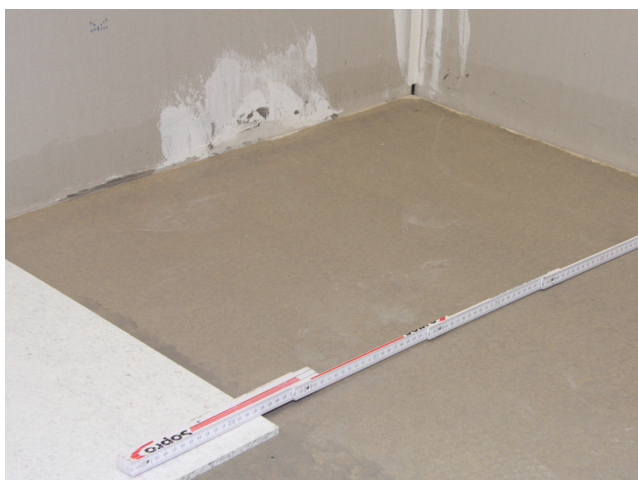
Die genaue Vermessung des Raumes vor der Verlegung ist empfehlenswert.