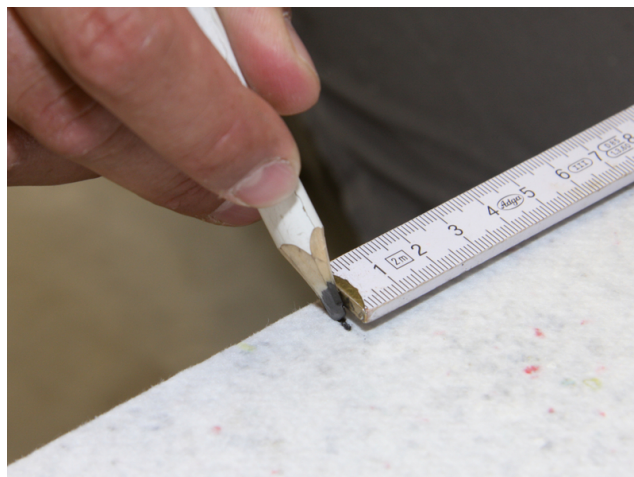
Anriss zum maßgenauen Schneiden einer Sopro FliesenDämmPlatte.