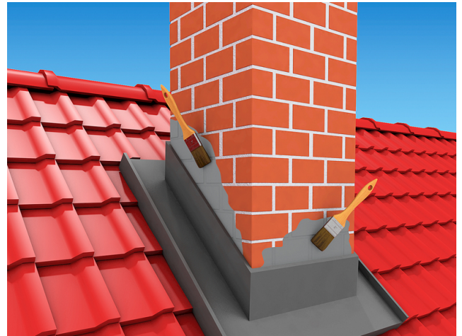
Abdichten von Anschlüssen an Schornsteine