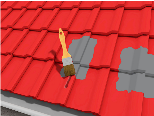
Abdichten und Ausbessern von Dachziegeln