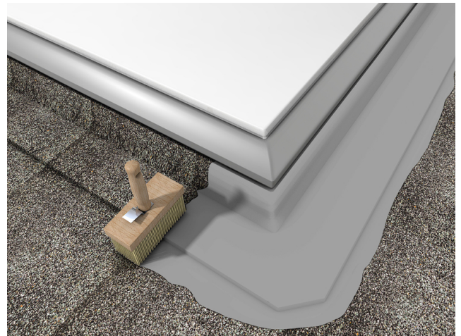
Abdichten von Anschlüssen und Übergängen auf Dächern