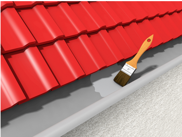
Abdichten und Ausbessern von Dachrinnen