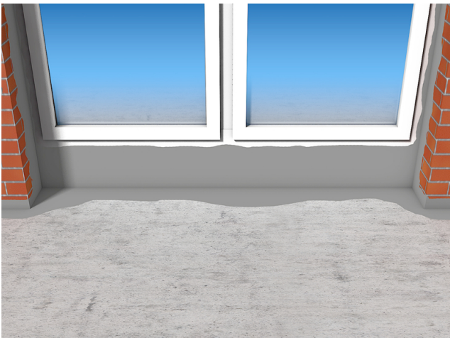
Andichten an Fensterrahmen