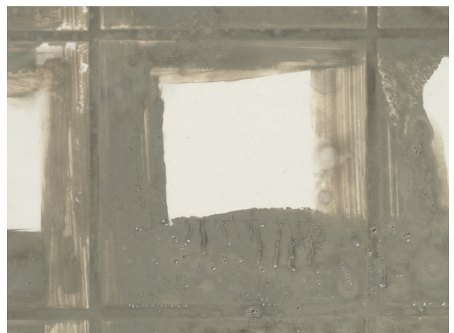
6 ... jedoch frühestens nach ca. 60 Minuten (temperaturabhängig), ist die Fläche zu säubern.