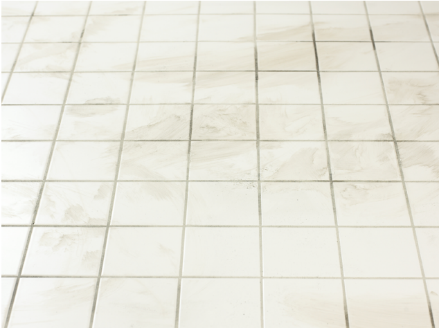
Alter, verschmutzter Belag mit unansehnlichen, verfärbten und verfleckten Fugen.