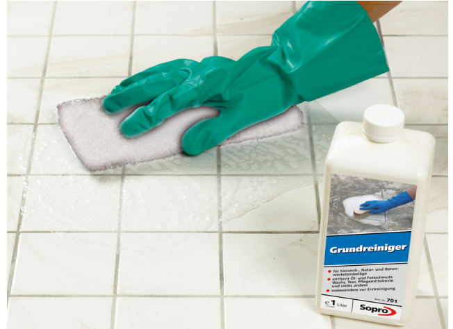
Reinigung der verschmutzten Fugen mit Sopro Abwaschpad grob bzw. fein (je nach Fliesenoberfläche) und Sopro Grundreiniger oder Sopro Bio-Intensiv-Reiniger.