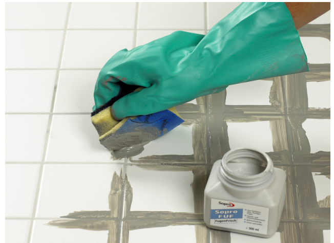
Die Fugen sind danach deckend (nicht überschüssig) mit Sopro FugenFrisch zu beschichten.