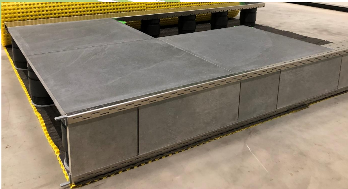
Abbildung 2: Verlegebeispiel VOLFI Alu Stufen-Profil mit ca. 20cm hoher Stufe