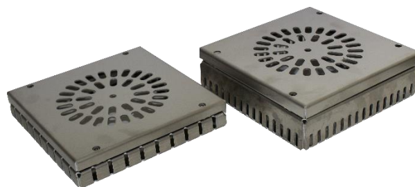
Abbildung 1: Draingully GU-AV 35-55mm und 60-90mm

Die Alu-Ausführung wird in 2,0 mm Materialstärke produziert.