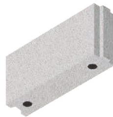
L x B x H in cm: 49,7 x 11,5 x 24,8 8 DF