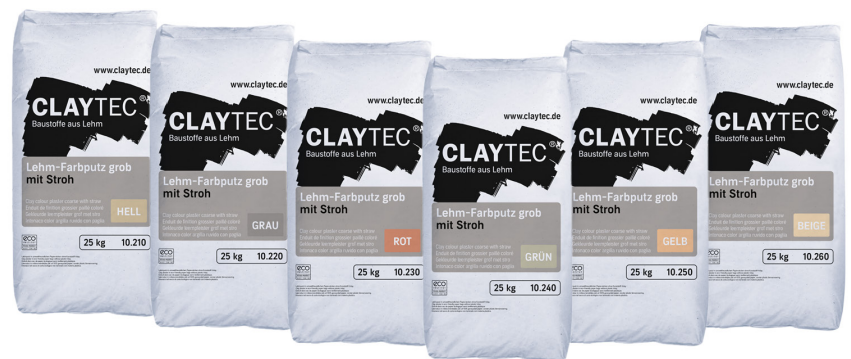
Je Farbton unterschiedliche Gebindelayouts