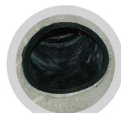
Element bündig aufsetzen Radius beachten