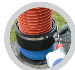
Spannband mit 6 Nm festziehen