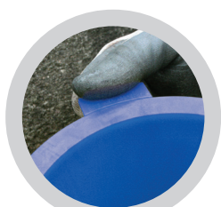
Transportsicherung der Spannhülse entfernen