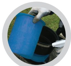
Einschlaghülse und Element wässern