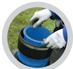
Spannhülse positionieren Pfeilrichtung beachten