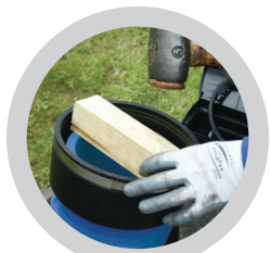
Spannhülse mit der Einschlaghilfe bündig einschlagen