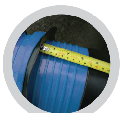
Schraubkragen entsprechend der Wandstärke einstellen