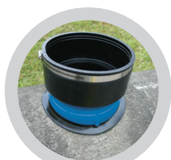
Anschlusselement einsetzen Einbaumarkierung beachten