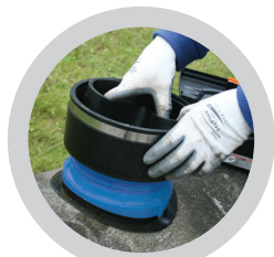
Muffenhülse in die EPDM - Muffe einsetzen