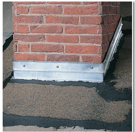
Kappeleiste am Schornstein mit SCHWARZER BLOCKER SPACHELMASSE und Bitumenbahn abgedichtet.